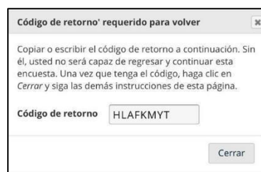
Figura 1: Código de retorno al formulario de postulación.

Casi todas las preguntas y carga de archivos son obligatorias, es decir, no podrá avanzar a la página siguiente si no ha cargado todos los datos dentro de la página. En caso de que una variable no haya sido rellenada, la plataforma le indicará cual es la que falta (Figura 2). Los datos no obligatorios estarán marcados como (opcional).