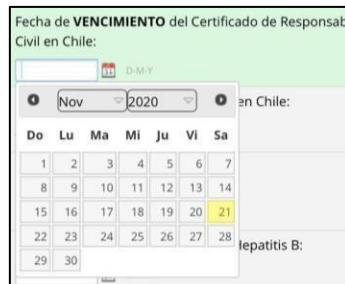
Figura 3: Selector de fechas.

Cuando suba más de 1 antecedente por tópico (Antecedentes Académicos, Actividades Extracurriculares y Antecedentes Laborales), debe cargar primero el más reciente y luego en orden hasta el más antiguo (ej. 2019, 2017, 2012...).